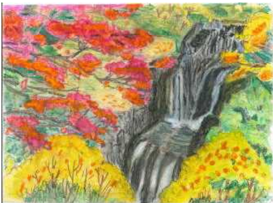
題：紅葉 【塗り絵】 作：堀 昭則

当施設では、ノーリフトケアを勧め、腰の負担は軽減してきておりますが、介護の現場に腰痛は付き物です。今回は職員が実施している腰痛体操をご紹介します。