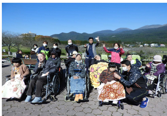
▲青空の下、みんなで記念撮影!