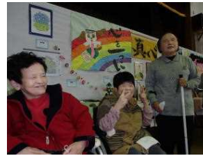
▲自分たちの作品の前では、ポーズ♪