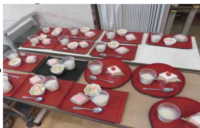
▲美味しそうなケーキ！思わずよだれが…

いントロクイズで楽しんだ後は茶話会でちよつと一息。ひし餅やひしケーキ等の中から自分で選んだお菓子と、甘酒が振る舞われました。皆さん「きれいなケーキやねえ」と言いながらも、思いきりかぶりついておられました。