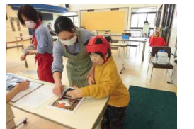
▲うへん、どっちがいいかまようなあ〜。両方食べたい！…はダメ？