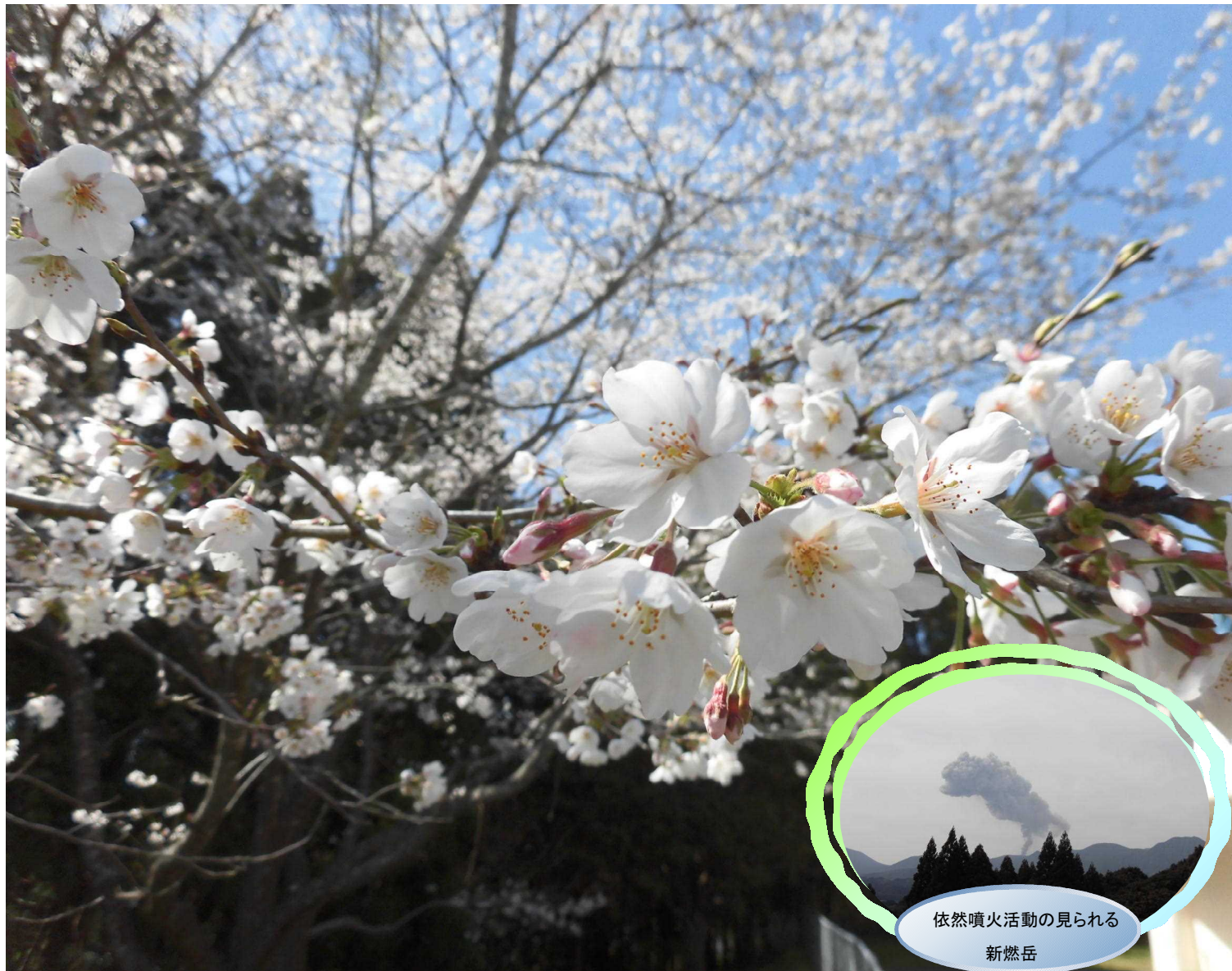
依然噴火活動の見られる 新燃岳