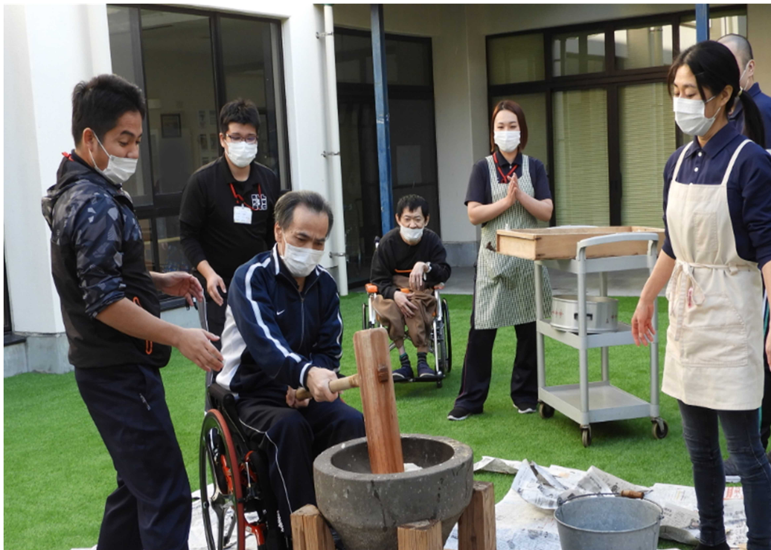
表紙:餅つき大会にて