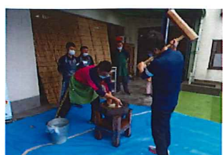
▲餅つきの技術も年々上がっています！？

十二月二十六日、毎年恒例の餅つき大会を実施しました。今年 は昨年引き続き感染症予防対策の為、餅つきは中庭で実施し、 利用者の方には室内から見学をして頂きました。園内には「よい しゅー！」という元気な掛け声が響き渡り、掛け声と共につかれ た熱々のお餅は、醤油餅とぜんざいにして頂きました。