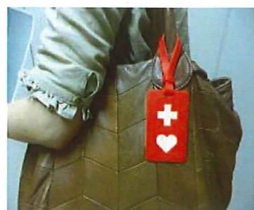
▲ヘルプマークのデザインとその使用例