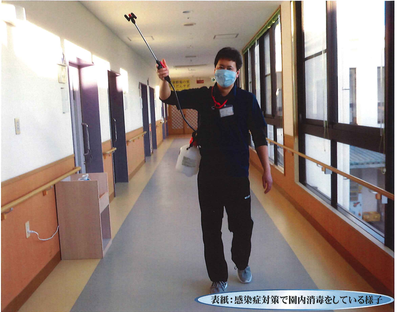
表紙：感染症対策で園内消毒をしている様子