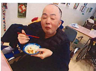
▲つきたてのお餅は柔らかくておいしいなあ〜♪