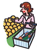
何を食べようかなあ～♪