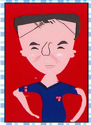
題:大切なボッチャの仲間