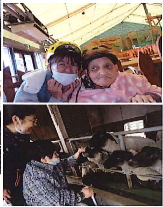
▲羊にエサやり！ …ちょっと怖いです😊