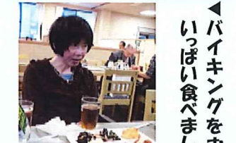
▲ケーキを食べに 行ってきます♪