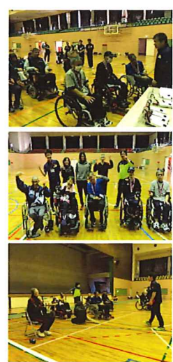
▼準優勝！メダルを頂きました♪

試合結果は、野菊の里Aチームが三勝一敗と健闘し、見事準優勝を収める事が出来ました。